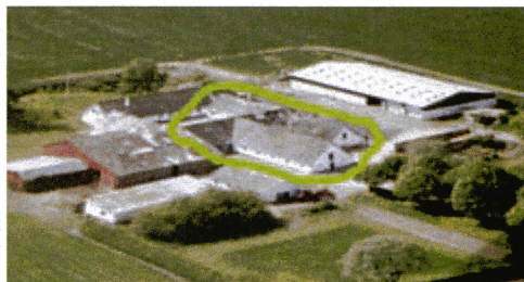
Luftfoto af den gamle gård. De afmærkede bygninger er nu revnet ned